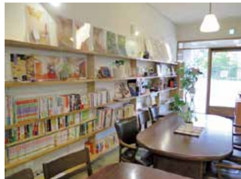
フロント。お気軽にお訪ね下さい。

※見学会は毎週月曜日の他、個別見学会を随時対応しておりますので、お問い合わせ下さい。