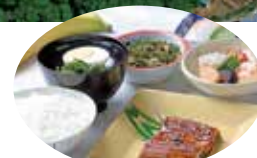
自社厨房による 美味しい家庭料理

●開設:H.7年11月15日●居室数:232室(一般居室:178室、介護専用居室:54室)●居室の広さ:(一般居室)27.56㎡~55.12㎡(介護専用居室)14.21㎡~23.20㎡●入居時費用:(全額前払方式)2082.7万円~5607.3万円(一部前払方式)249.1万円~670.6万円●土地:賃貸借●建物:賃貸借●事業主体:株式会社エヌエムライフ