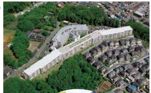
緑豊かな自然環境