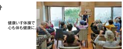
健康いす体操で 心も体も健康に。