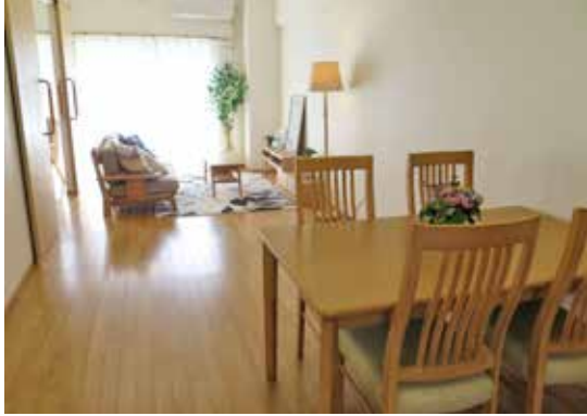
モデルルーム (Sタイプ)

●開設:2018年11月10日●居室数:17戸●居室広さ:62.52㎡●入居時費用:月額払い63,000円～79,200円(敷金2ヶ月分)●生活サポート費:1人入居32,400円・2人入居45,360円(税込)●共益費:5,000円(非課税)●建物:賃貸借(更新期間30年、以降5年ごとの更新)●事業主体:株式会社コミュニティネット